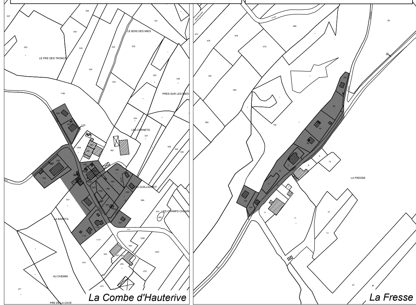
La Combe d'Hauterive